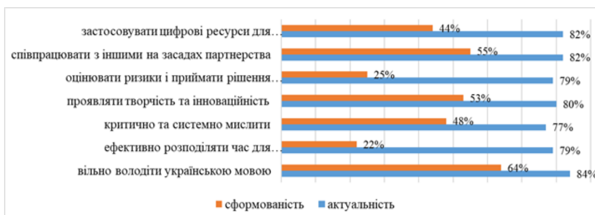
Рис. 2. Результати оцінювання майбутніми фахівцями з дошкільної та початкової освіти актуальності наскрізних умінь для сучасного педагога та ступінь їх сформованості

У руслі проблематики статті актуалізовано розвиток наскрізних умінь для особистісного та професійного становлення майбутніх педагогів, що підтверджують проведені опитування серед здобувачів вищої освіти за спеціальностями: 012 «Дошкільна освіта» та 013 «Початкова освіта». Респондентам було запропоновано оцінити (за школою вагомості від 1 до 10) актуальність наскрізних умінь для сучасного педагога та ступінь їхньої сформованості у себе (рис. 2).