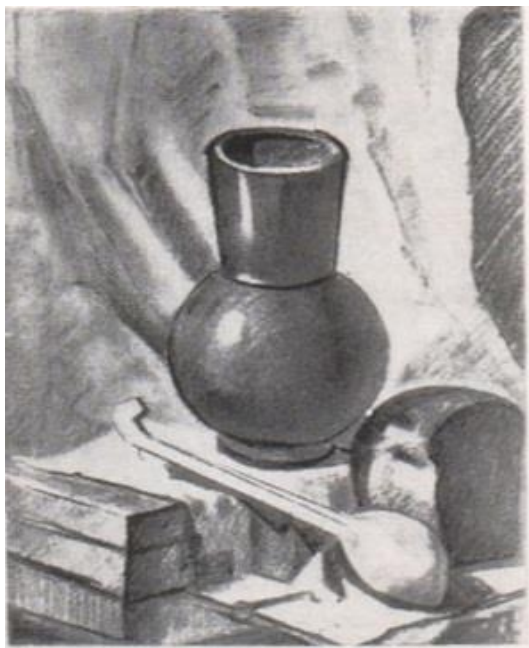
Рис. 3. 3. Третій етап виконання натюрморту: тональна проробка предметів