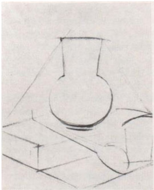
Рис. 3.1. Перший етап виконання натюрморту з побутових предметів: пошук формату, композиційного рішення