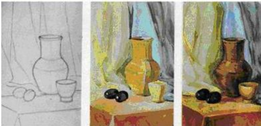
Рис. 2.1. Етапи виконання натюрморту учнями на уроках образотворчого мистецтва