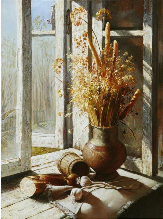
Рис. 1.1. Анненков Д. «Згадки про літо». Олійний живопис. 2010 р.