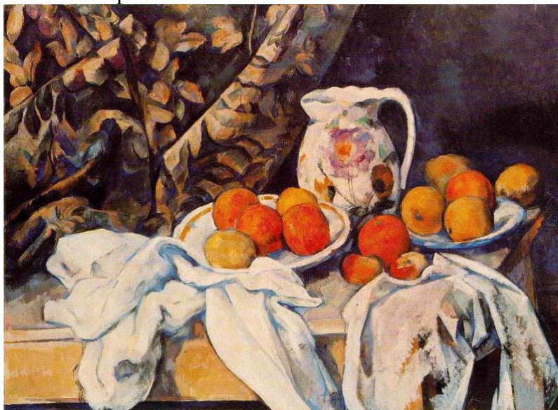
Рис.1.3. Сезанн П. «Натюрморт з драпіривою та глеком». Олійний живопис. 1899 р.