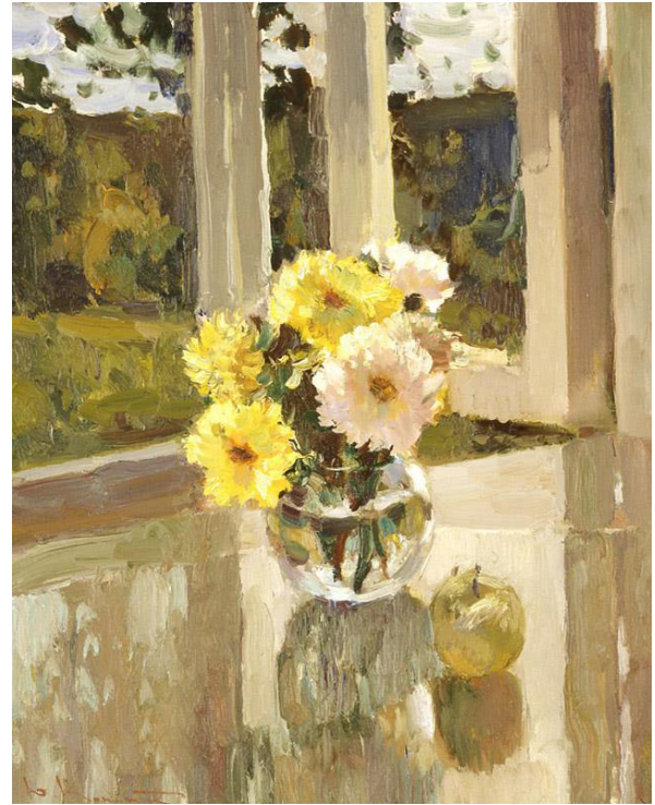
Рис. 1.2. Константинов Ю. «Вікно». Олійний живопис. 2007 р.