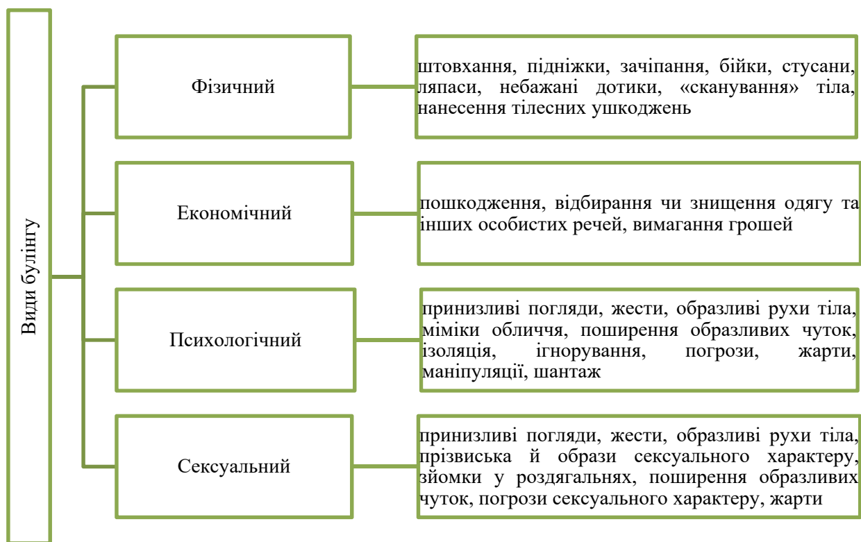
Рис. 1. Види булінгу (згідно Закону України «Про внесення змін до деяких законодавчих актів України щодо протидії булінгу (цькуванню)»)

Типовими ознаками булінгу (цькування) є: систематичність (повторюваність) діяння; наявність сторін – кривдник (булер), потерпілий (жертва булінгу), спостерігачі (за наявності); дії або бездіяльність кривдника, наслідком яких є заподіяння психічної та/або фізичної шкоди,