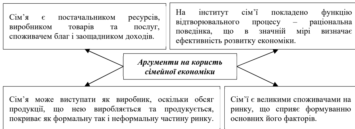
Рис. 1. Аргументи на користь становлення та розвитку сімейної економіки

вплив на прогресивний чи регресивний розвиток економічної системи. Закордонний дослідник М. Давлатов трактує “сімейну економіку як первинну і найважливішу ланку усієї соціально-економічної системи в країні... сімейна економіка є одним із найважливіших складників національної економіки” (Давлатов, 2016). Базовим поняттям для сімейної економіки виступає економіка з акцентом на її формування в сім’ї та сім’єю (Пасько, 2017). Аргументи на користь становлення та розвитку сімейної економіки представлені на рисунку 1.