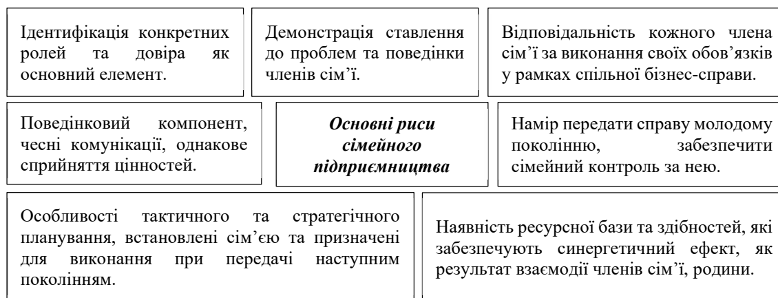
Рис. 2. Розкриття змісту сімейного підприємництва через основні його характеристики

Ми пропонуємо розуміти під сімейним підприємством – суб'єкт господарювання, діяльність якого заснована на приватній власності та праці членів однієї сім'ї, які мають родинні зв'язки та проживають на спільній території. Сімейний бізнес – це діяльність, справа, робота, якась заняття, що реалізується і засноване на високій довірі, а діти, які зростають в сім'ї, що займається бізнесом, формуються як покоління нових кадрів для сімейної справи. Розкриття змісту сімейного підприємництва через основні його характеристики ми зробили спробу представити на рисунку 2.