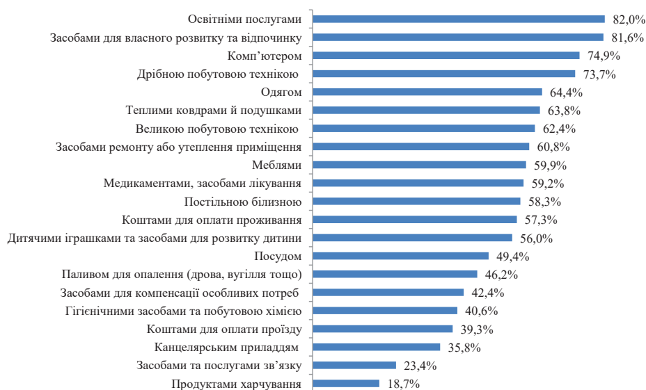
Рис. 1. Частка сімей ВПО, що не здатні власними коштами забезпечити умови, необхідні для задоволення базових потреб

Регресійний аналіз дозволив визначити деякі чинники, що впливають на здатність сімей забезпечити такі потреби (лінійна регресія, p \leq 0.05 ). Так, рівень доходів впливає на здатність сім'ї ВПО задовольняти всі потреби, окрім потреб в поліпшенні умов проживання – коштовність останніх виходить за межі можливостей більшості сімей. Проживання в орендованому житлі зменшує спроможність сімей задовольняти потреби в належних побутових умовах життєдіяльності, речах першої необхідності та засобах розвитку і відпочинку, в той час як поліпшення довготривалих умов проживання для них може не бути актуальним. Придбання товарів першої необхідності та оплата проживання є важкими для сімей, де є лише одна доросла людина, товарів першої необхідності – для сімей з великою кількістю дітей,