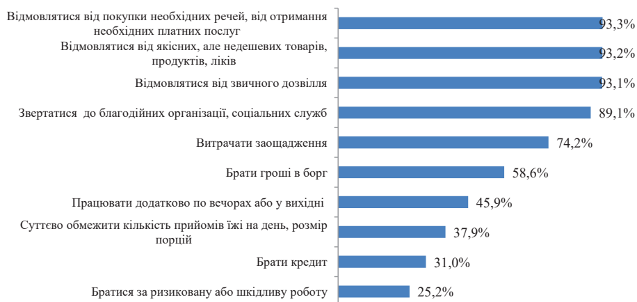
Рис. 3. Частка сімей, що використовувала певні способи опитування важкої ситуації (%)