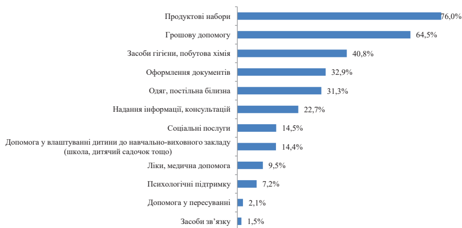
Рис. 4. Розподіл сімей ВПО з дітьми – учасників опитування відповідно до видів отриманої допомоги (%)

Висновки та перспективи подальших досліджень. Сім'ї ВПО з дітьми, що звертаються за соціальною допомогою, відрізняються за складом, рівнем доходів та доступними ресурсами, проте не можуть повною мірою задовольнити потреби в умовах проживання, функціонування та розвитку сім'ї, мають проблеми матеріально-побутового або психологічного характеру та використовують пасивні (різні форми економії, борги та позики, звернення за допомогою) та активні (пошук додаткового заробітку) стратегії їхнього подолання. Характер проблем і потреб сімей та вибір стратегії опанування складними обставинами до певної міри залежить від складу сім'ї: кількості дітей, дорослих, непрацездатних осіб та осіб, котрі потребують догляду. Найвність та кількість непрацездатних членів та таких, котрі потребу-