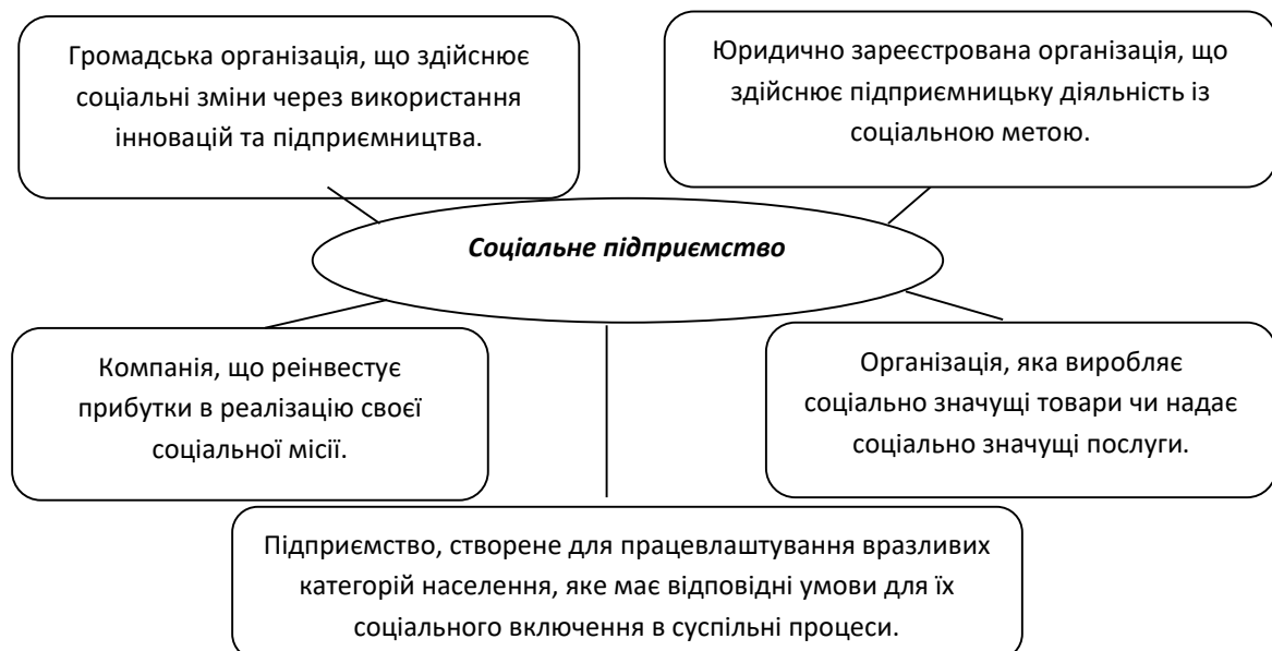
Рис. 1. Розкриття змісту економічної категорії “соціальне підприємство” (згруповано авторами на основі джерела [18])

Економічні категорії “соціальне підприємництво” (англ. social entrepreneurship) і “соціальний підприємець” (англ. social entrepreneur) вперше згадуються в 1960–1970-х роках в англійській літературі, присвяченій питанням соціальних змін. Широкого використання в теорії та практиці економіки вони набули в 1980-х роках, як вважається завдяки популяризації з боку американського бізнес-консультанта і менеджера Білла Дрейтона, якого часто називають “хрещеним батьком соціального підприємництва” [17]. Прийнято вважати, що в сучасному вигляді соціальне підприємництво зародилося в 1980-ті роки. Фаза бурхливого розвитку припадає на 1990-ті. Спровоковано це низкою чинників, зокрема зростання і активізація ролі некомерційних організацій, розвиток транспорту й інфраструктури, поява новітніх засобів зв’язку. Розкриття змісту категорії “соціальне підприємництво”, ми зробили спробу представити візуалізовано на рисунку 1.