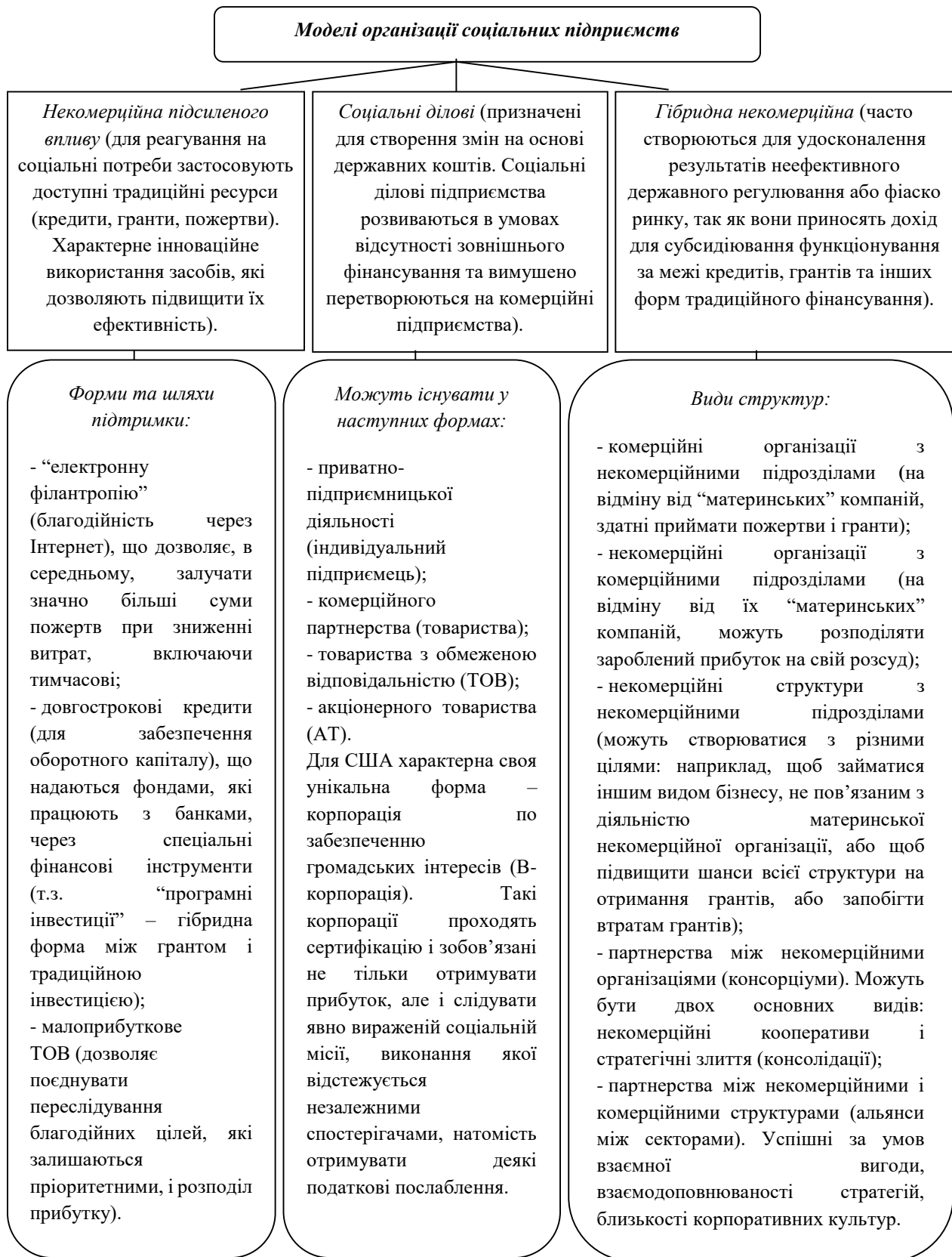
Рис. 3. Класифікація соціальних підприємств за організаційно-правовими формами (складено авторами на основі вивченого і опрацьованого публіцистичного матеріалу та власних спостережень)