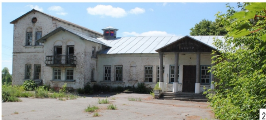
Рис. 1. Палацовий комплекс біля с. Мала Клітинка: 1 — план комплексу; цифрами позначені: 1 — палац; 2 — спалена стайня; 3 — баня; 4 — руїни котельні; 5 —

Наступні зусилля, на наш погляд мають бути спрямовані на консервацію та поступове відновлення і реставрацію споруд палацового комплексу другої половини 19 століття, а також благоустрій території, який має включати її розчистку та відновлення парку. Дослідницькі роботи, необхідні для подальшого вивчення палацу, а також прилеглої території та території Махнівської ОТГ роблять маєток чудовою базою для проведення різних видів практик, в тому числі археологічних.