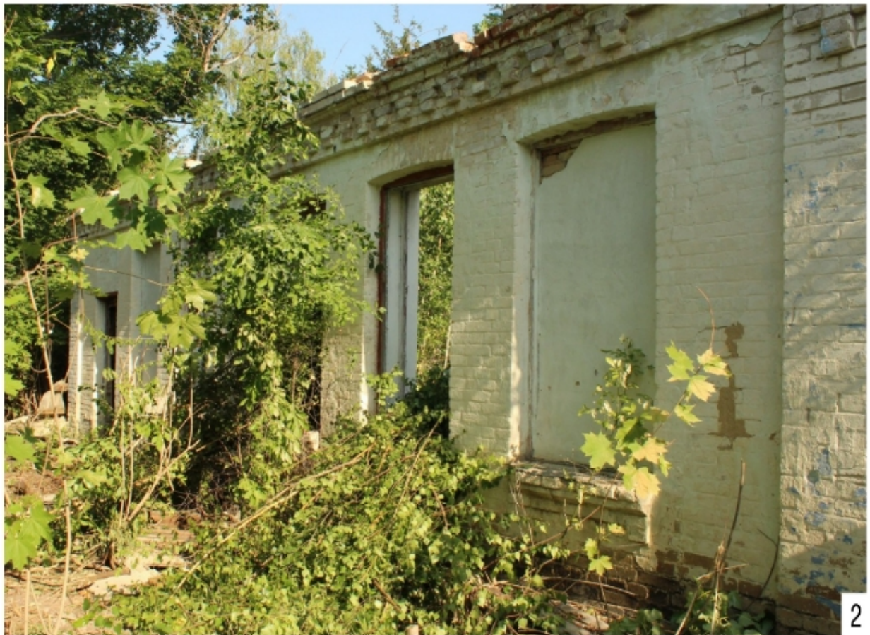
Рис. 4. Палацовий комплекс біля с. Мала Клітинка: 1-2 фото зруйнованої стайні, вид з південної сторони.