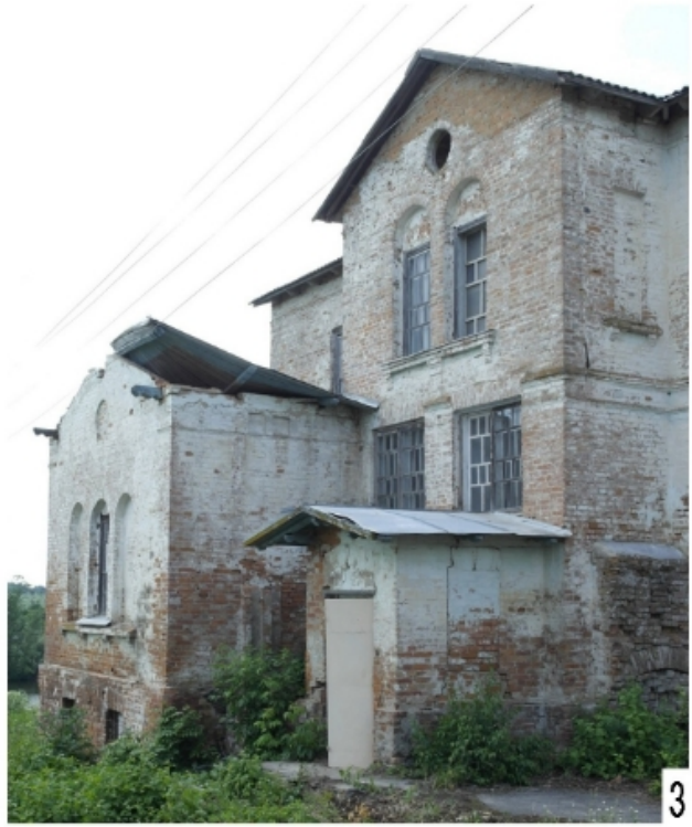
Рис.2. Палац біля с. Мала Клітинка: 1 — вид східної стіни, червоним позначено замуровані двері; 2 — вид східної стіни та місця, де була прибудована тераса; 3 — вид із півдня.