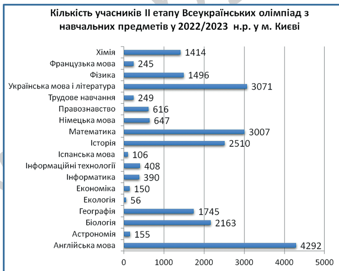
Рис. 1. Кількість учасників II етапу Всеукраїнських учнівських олімпіад з навчальних предметів у 2022/2023 н. р. у м. Києві.

За результатами випробувань визначено 10790 переможців II (районного) етапу, яких було запрошено до участі у III (міському) етапі (рис. 1).