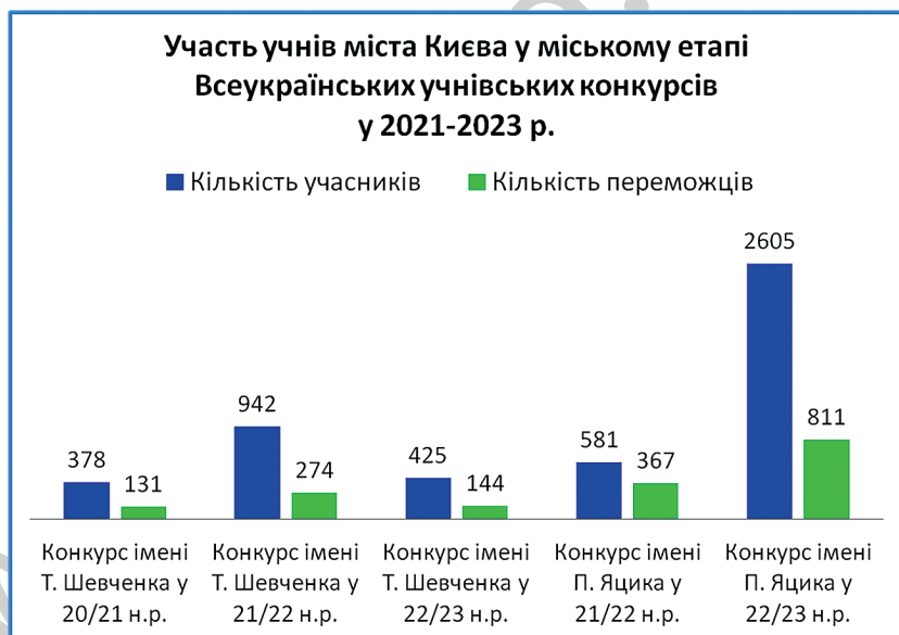
Рис. 5. Участь учнів міста Києва у міському етапі Всеукраїнських учнівських конкурсів у 2021–2023 роках

Динаміку участі в конкурсах за останні три роки подаємо в діаграмі (рис. 5).