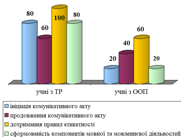
Рис. 3. Кількісні результати стану сформованості комунікативних навичок у спеціально створених ситуаціях

Перейдемо до розкриття результатів діагностичної роботи на III етапі дослідження. Унаочнення кількісних результатів стану сформованості комунікативних навичок у дітей молодшого шкільного віку з особливими освітніми потребами та у дітей молодшого шкільного віку з типовим розвитком за результатами виконання діагностичних завдань у спеціально створених ситуаціях представлено в рис. 3.