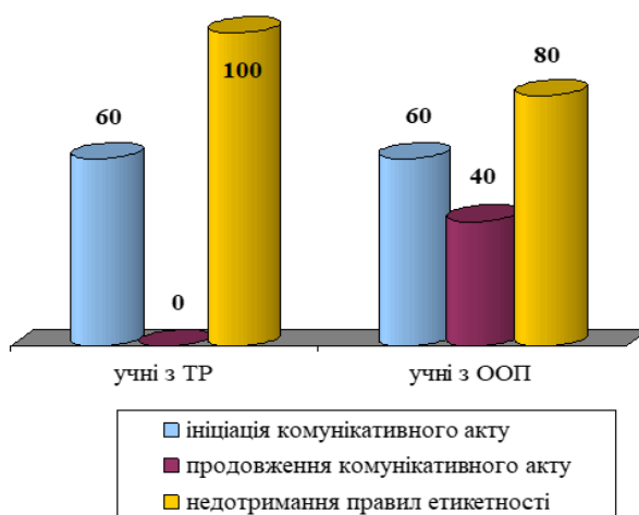
Рис. 1. Кількісні результати сформованості комунікативних навичок за результатами інтерв'ювання батьків

Кількісні результати стану сформованості комунікативних навичок у дітей молодшого шкільного віку з особливими освітніми та у дітей молодшого шкільного віку з типовим розвитком за результатами інтерв'ювання батьків представлено в рис. 1.