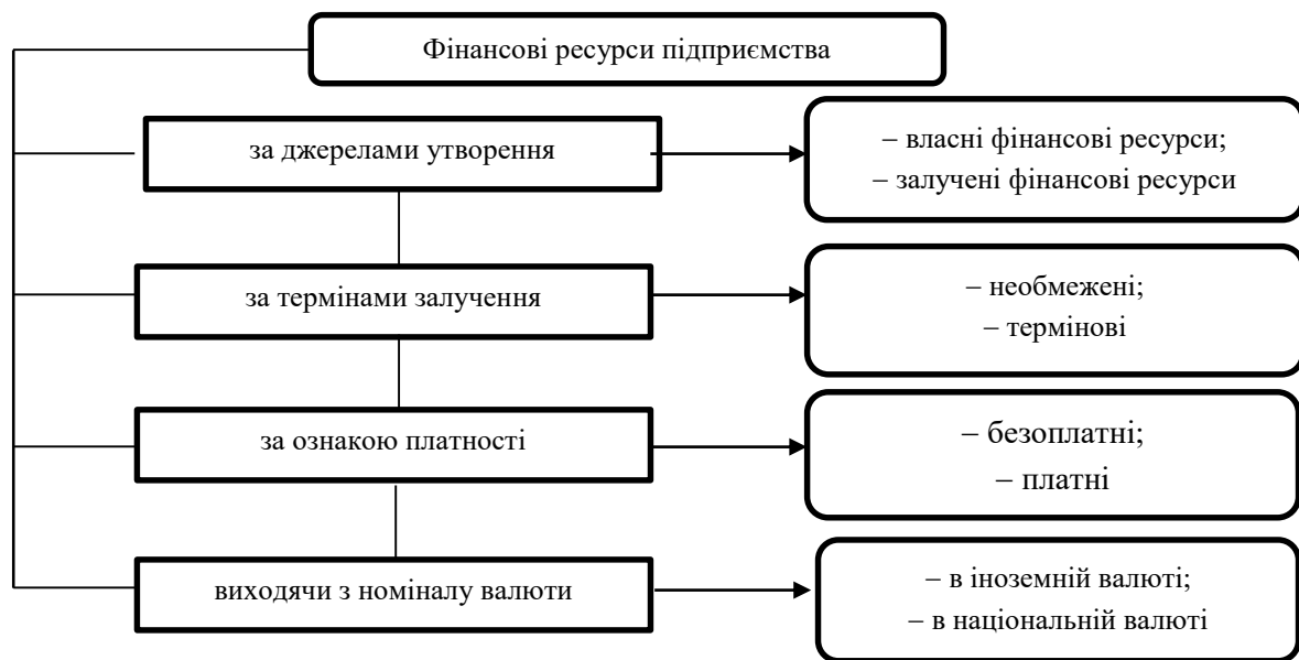
Рис.1.1.Класифікація фінансових ресурсів підприємства (Джерело: підготовлено за [13, с. 229 - 233])

У подальшому науковому дослідженні зазначимо, що управління власними фінансовими ресурсами підприємства в умовах воєнного стану є наразі досить актуальним та зумовлене необхідністю подолання тих ризиків й загроз, які негативно впливають на формування й використання таких джерел фінансування, як чистий прибуток, статутний та резервний капітал суб'єкта господарювання, амортизаційні відрахування. Зокрема, найбільший вплив умови воєнного стану здійснюють на формування чистого прибутку, що, передусім, пов'язано із такими чинниками, як: зміна системи логістики, неможливість провадити фінансово-господарську діяльність підприємства в умовах окупації або повного знищення підприємства, потреба й можливості релокації бізнесу, відтік робочої сили тощо. Усе це знижує доходи суб'єктів господарювання та підвищує витрати на ведення ними господарської діяльності, що, в свою чергу, призводить й до зниження прибутковості й рентабельності підприємства (або до їх збитковості), а також знижує обсяги податкових надходжень до бюджету [15]. Зауважимо, що для підприємств завжди є актуальною проблема співвідношення власних, позикових і залучених фінансових ресурсів. Від ступеня оптимальності їхньої структури залежить можливість реалізації фінансової стратегії підприємства.