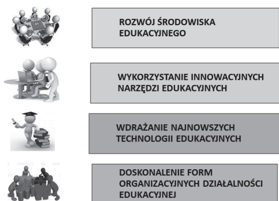
Rys. 2. Kierunki optymalizacji procesu edukacyjnego

realizować w następujących kierunkach: rozwój środowiska edukacyjnego (szkoła, uniwersytet, instytucje edukacji pozaszkolnej); wykorzystanie innowacyjnych narzędzi edukacyjnych (e-podręczniki, kursy na odległość, zasoby elektronicznych gier edukacyjnych, drukarki 3D); wprowadzenie najnowszych technologii uczenia się (komputerowe systemy modelowania »CMS«, usługi w chmurze, rozszerzona i wirtualna rzeczywistość, wykorzystanie innowacyjnych technologii informacyjno-komunikacyjnych »ICT« w procesie edukacyjnym); doskonalenie form organizacyjnych działalności edukacyjnej (e-mail, webinaria, spotkania on-line do komunikacji z rodzicami) 6 . Celem nowych praktyk jest podniesienie zarówno jakości usług edukacyjnych, jak i poziomu osiągnięć edukacyjnych uczniów (rys. 2).