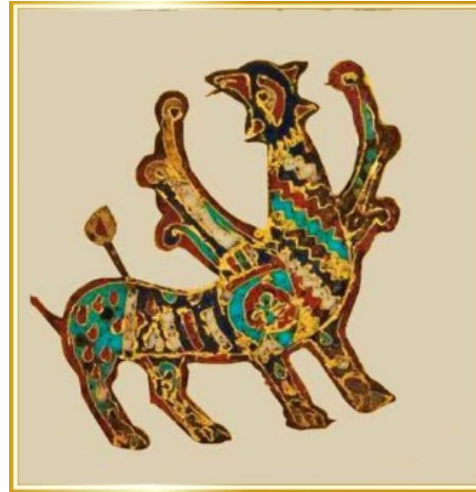
П. 2. Image of a griffin with a diadem. 12 th – first half of the 13 th century. Princely Kyiv. Gold, hot cloisonne enamel. Treasury of the National Museum of the History of Ukraine. Kyiv. Ukraine. Рис. 2. Зображення грифона з діадеми. XII – перша половина XIII ст. Княжий Київ. Золото, гаряча перетинчаста емаль. Скарбниця Національного музею історії України. м. Київ. Україна