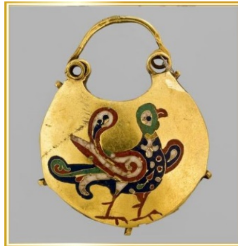
П. 4. Kolt with Dove 11 th – first half of the 13 th century. Princely Kyiv. Gold, hot cloisonne enamel. Treasury of the National Museum of the History of Ukraine. Kyiv. Ukraine. Рис. 4. Колт із голубом. XI – перша половина XIII ст. Княжий Київ. Золото, перетинчаста гаряча емаль. Скарбниця національного музею історії України. м. Київ. Україна.