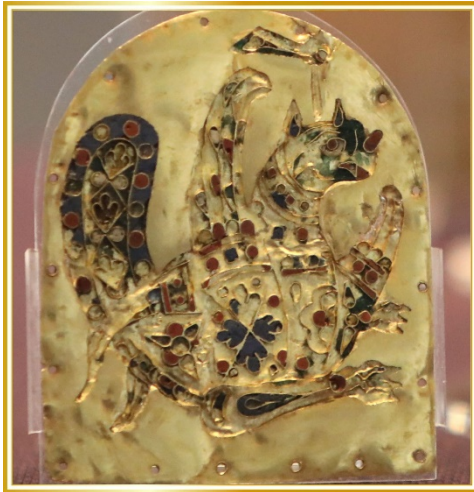
П. 1. Image of Semargl with a diadem. X century Byzantium, Constantinople? Gold, membranous hot enamel. Archaeological Museum «Veliky Preslav». Преслав, Болгарія. Рис. 1. Зображення Семмурва з діадеми. X ст. Візантія, Константинополь? Золото, перетинчаста гаряча емаль. Археологічний музей «Великий Преслав». м. Преслав, Болгарія.

Analysing the differences in the composition of enamel mixtures, it should be noted that the masters of princely Kyiv found their excellent way to obtain bright red colours of enamel through the use of selenium, which is absent in the coating materials of