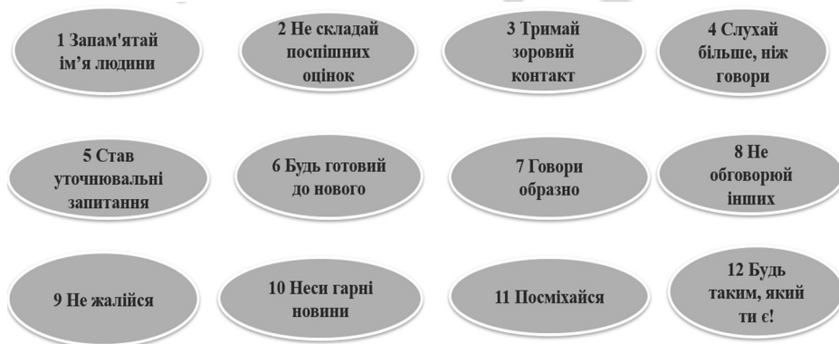
Рис. 3. Правила ефективної комунікації

Виклад основного матеріалу. Існує чотири мистецтва — ГОВОРИТИ, СЛУХАТИ, ЧИТАТИ і ПИСАТИ. Звичайно, ми володіємо основами цих навичок, і тому завдання полягає тільки в їх удосконаленні для застосування в щоденній роботі і в сьогоdnішніх умовах. Якщо ви прагнете бути лідером або керувати іншими, вам потрібна справжня компетентність у цих галузях, оскільки комунікацію можна назвати сестрою лідерства. Правила ефективної комунікації подано на рис. 3 .