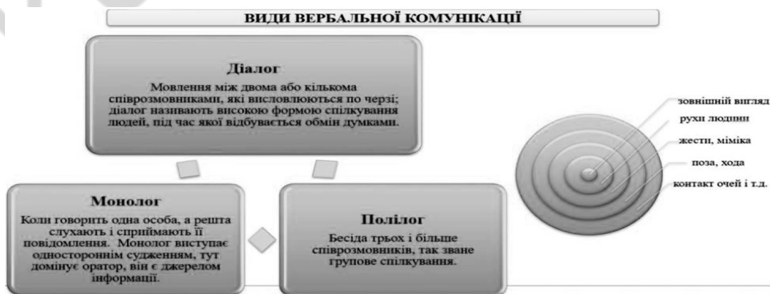
Рис. 2. Види вербальної комунікації

хоча б на своєму початку допускати вербалізацію. У межах вербальної комунікації виділяються форми мовленнєвої комунікації: діалог, монолог, дискусія. Види вербальної комунікації подано на рис. 2 .