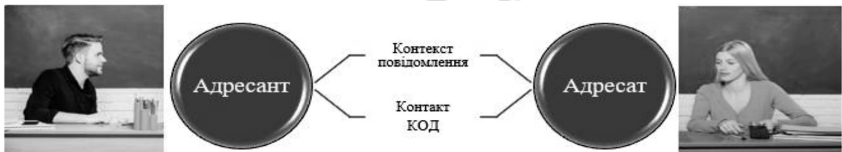
Рис. 1. Процес спілкування

Процес спілкування можна показати ілюстрацією (див. рис. 1 ):