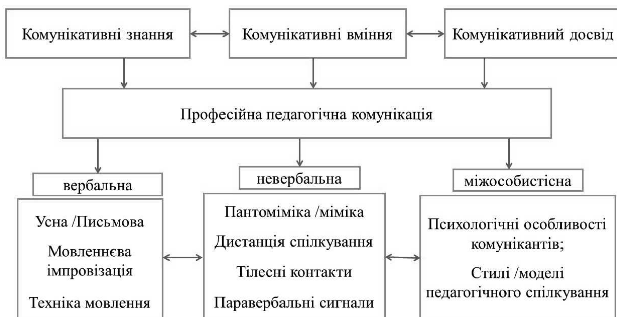
Рисунок 2 - Схема розвитку педагогічної комунікації

Після з'ясування рівня сформованості комунікативних умінь, навичок міжособистісної взаємодії та потреб кожного конкретного вчителя у опануванні новими здатностями педагогічної комунікації пропонуємо таку схему її розвитку у післядипломній освіті: