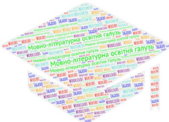
Рис. 1. Хмара слів із використанням онлайн-сервісу WordArt

На нашу думку, використання яскравої графіки у вигляді хмар слів на уроках української мови дозволить зробити акценти на ключових моментах вивчення тем із розділів «Мова і мовлення», «Текст», «Речення». Це, у свою чергу, сприяє переосмисленню та систематизації навчального матеріалу з мови, формуванню мовленнєвих умінь і навичок. До того ж, використання різних кольорів, шрифтів та форм хмар дозволить учням швидше опанувати новий мовний матеріал завдяки активному залученню зорової пам'яті.