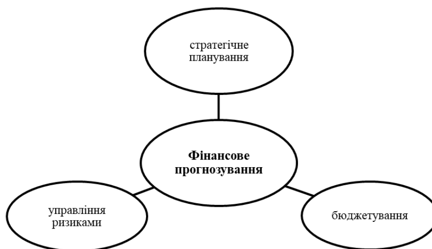
Рис. 2. Взаємозв'язок фінансового прогнозування та елементів стратегічного управління

Ефективність фінансового прогнозування в системі стратегічного управління підприємством значною мірою залежить від його інтеграції з іншими елементами, такими як стратегічне планування, бюджетування та управління ризиками (рис. 2).