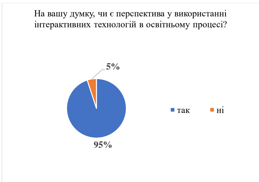
Рис. 5. Результати анкетування щодо перспективності використання ігор в освітньому процесі.

Моделювання подій є ефективним для засвоєння теоретичної бази для 90 % студентів. Тільки 10 % респондентів розглядають гру як індивідуальну роль і 25 % – як самостійну роль. Проте 75 % відзначають, що моделювання подій – це робота в команді. Також варто підкреслити, що неефективність цієї технології не було відмічено жодним студентом.