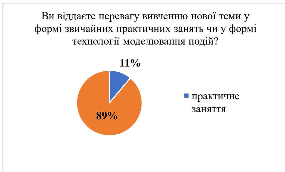
Рис. 1. Результати анкетування щодо переваги вивчення нової теми у формі звичайних практичних занять чи у формі моделювання подій.

Отримано 54 анкети від здобувачів освіти, які брали участь у моделюванні події на практичних заняттях у межах змістових модулів з організації роботи сучасних пресслужб.