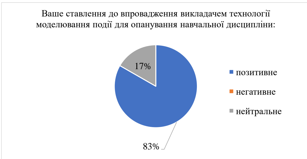
Рис. 3. Результати анкетування щодо ставлення до впровадження викладачем технології моделювання події для опанування навчальної дисципліни.

44 % опитаних студентів бачать себе в ролі пресекретаря, 39 % – у ролі модератора, лише 17 % – у ролі менеджера (див. рис. 2). Варто відзначити, що дехто зі студентів навмисне змінював ролі, щоб спробувати себе в різних функціях. У зазначеному питанні анкети ролі спічрайтера та копірайтера не обрав жоден студент.