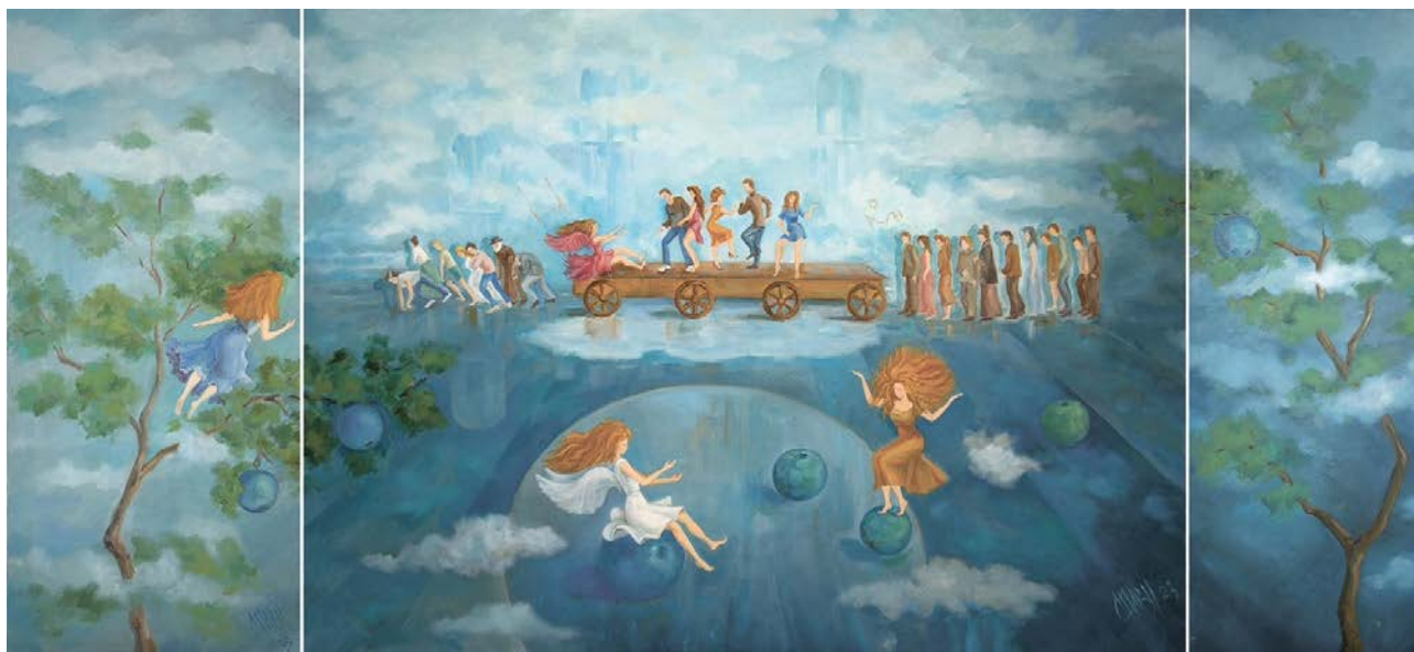
Рис. 7. Ситник І. В. Колісниця життя. 2023 р. Полотно, олія