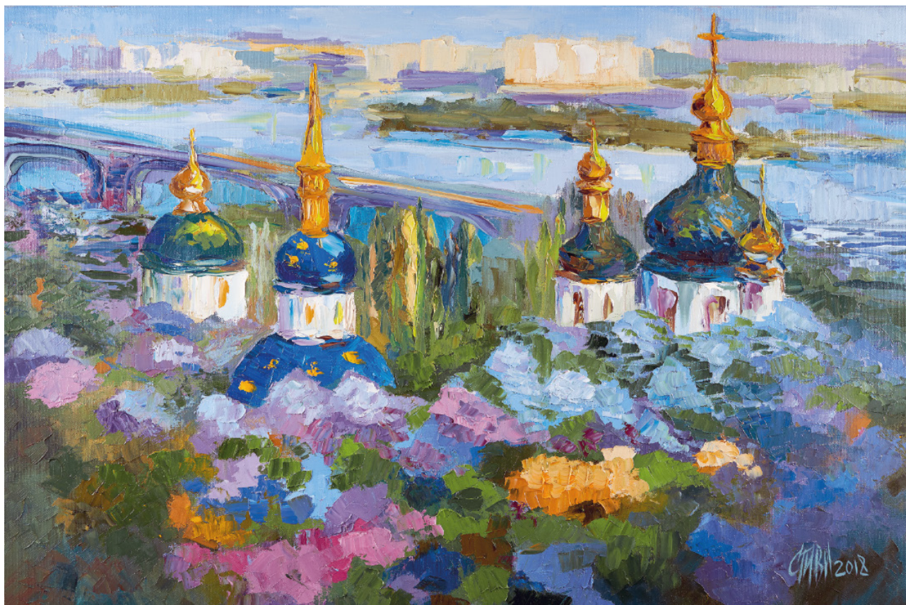
Рис. 2. Ситник І. В. Видубицький монастир. 2018 р. Полотно, олія