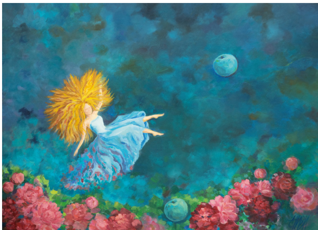
Рис. 6. Ситник І. В. Трансформація. 2022 р. Полотно, олія