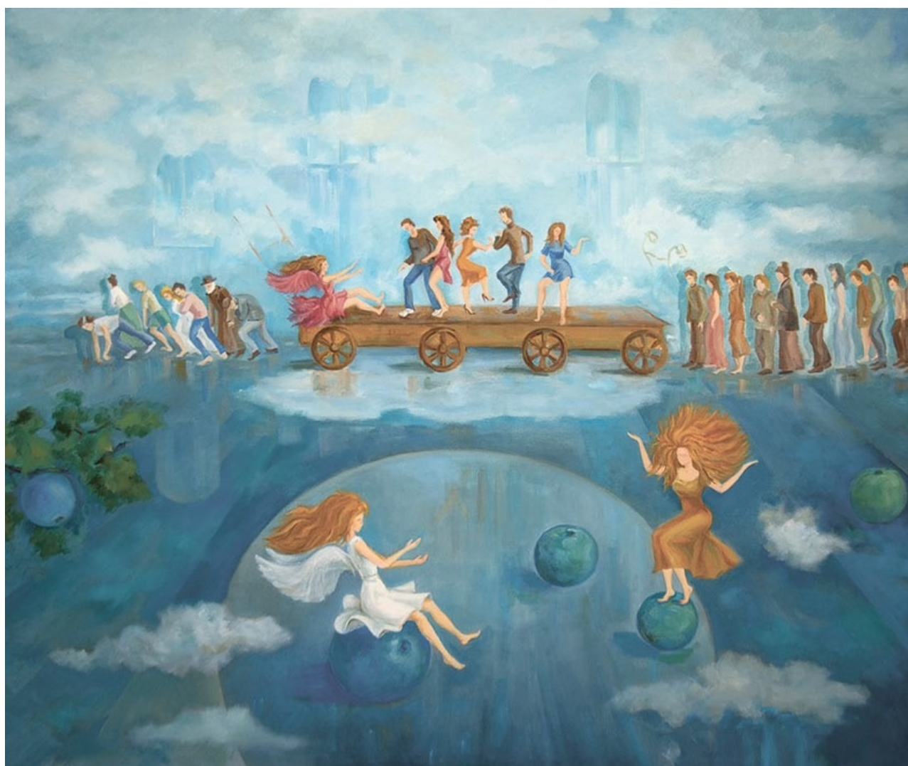
Рис. 8. Ситник І. В. Колісниця життя (фрагмент). 2023 р. Полотно, олія