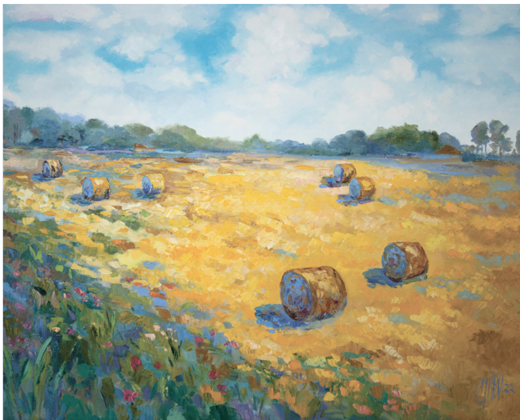
Рис. 5. Ситник І. В. Снопи... По дорозі в Кмитівський музей. 2022 р. Полотно, олія