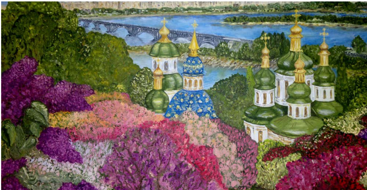
Рис. 1. Ситник І. В. Видубицький монастир. 2010 р. Полотно, олія