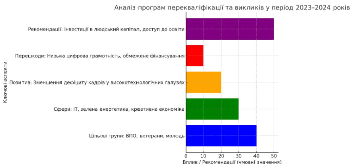
Рис. 1. Аналіз програм перекваліфікації та викликів у період 2023–2024 років

Як вже зазначалось, одним із ключових ризиків для економічної безпеки є безробіття. Його високий рівень знижує рівень доходів населення, підвищує соціальну напругу і створює додаткове навантаження на бюджет. У багатьох країнах міграція трудових ресурсів стає ще однією загрозою, оскільки призводить до втрати висококваліфікованих кадрів, необхідних для розвитку економіки.