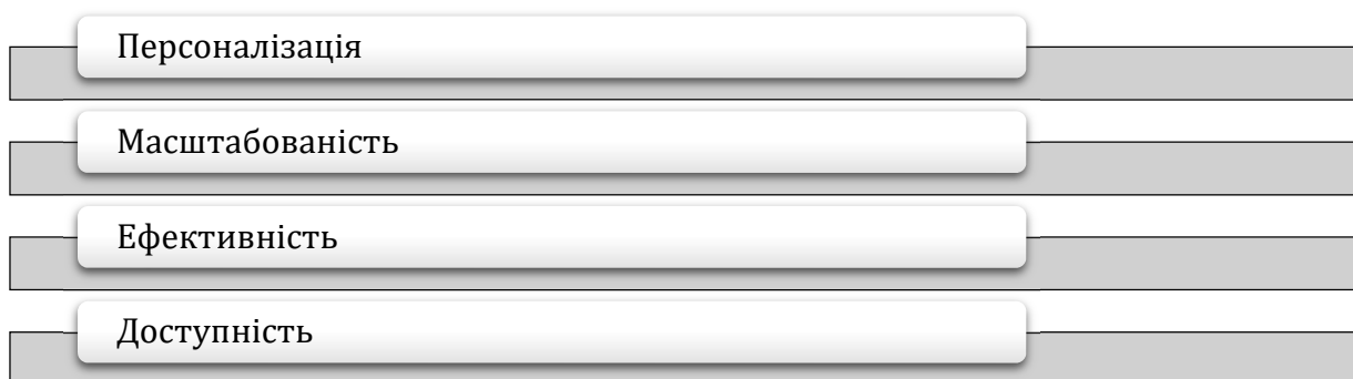
Рис. 2. Ключові переваги використання ШІ в електронних міжнародних маркетингових комунікаціях

Незважаючи на те, що використання штучного інтелекту (ШІ) у міжнародних маркетингових комунікаціях має безліч переваг (рис. 2), воно має і ризики, пов'язані з етичними аспектами (рис. 3). Однією з основних етичних ризиків є поширення упереджених даних, і некоректних алгоритмів. ШІ-системи, особливо якщо вони навчалися на великих об'ємах даних, можуть копіювати існуючі упередженості, якщо набір даних, на якому вони були навчені, був упереджений або перекоханий. Ці упередженості можуть спричинити неправильне розуміння даних, усунення висновків, завдати шкоди репутації компаній, вплинути на прийняття стратегічних рішень або викликати невдоволення клієнтів та партнерів.