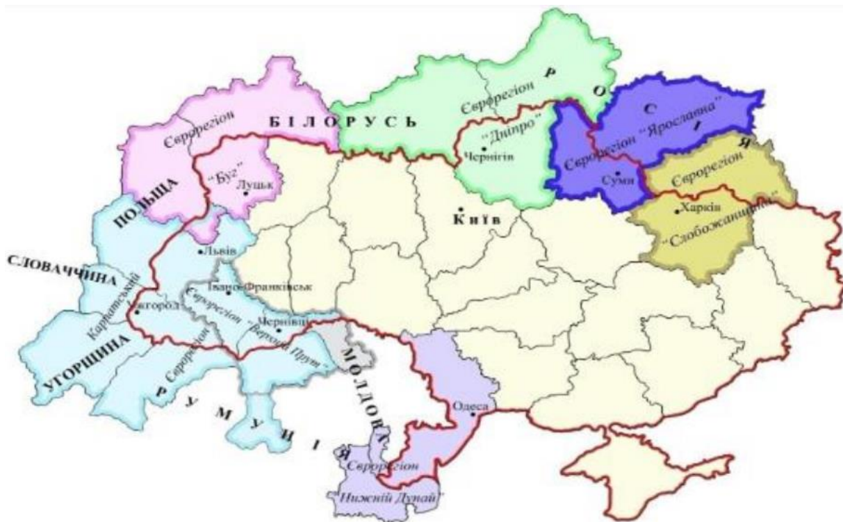
Рис. 1. Співпраця України з євро регіонами

енергетичної безпеки. Нафтопровід будувався протягом 1996—2002 років. Вартість будівництва – 453 млн. дол. США. Проте з 2002 до 2004 року нафтопровід Одеса-Броди простоював, оскільки уряд України не отримав від нафтових компаній, що працюють на Каспії, гарантій щодо завантаження його сировиною. На сьогоднішній день проект «Одеса-Броди-Гданськ» фактично не реалізовано. Українська ділянка використовується для постачання каспійської нафти на українські нафтопереробні заводи [3].