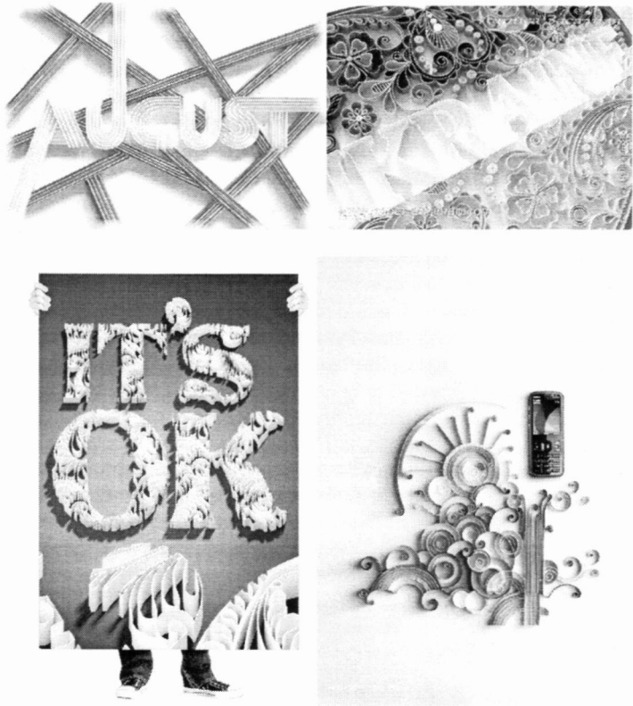
Рис. 3. Фактурний квілінг з різною штриховкою в елементах фірмового стилю