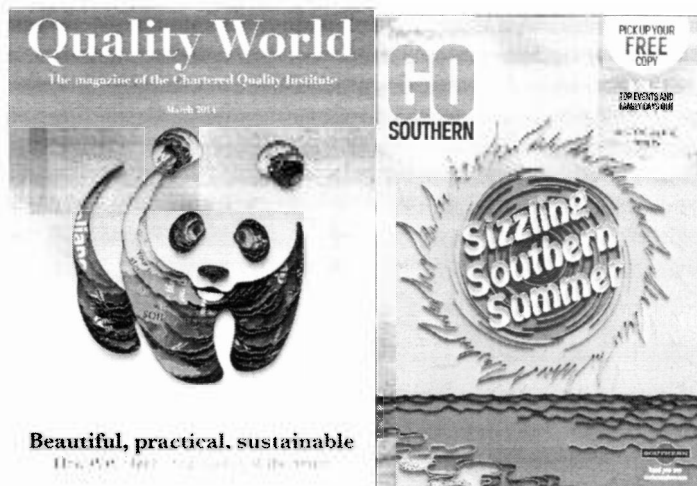
Рис. 2. Контурний квілінг у плакатній графіці

Фактурні лінійні форми є найхарактернішими й найулюбленішими у техніці квілінгу, оскільки дозволяють відтворити характер різних видів штриховки: паралельної, контурної, перехресної, хвилястої, каракулеподібної, дртоподібної тощо. Скручені у спіраль смужечки паперу утворюють пластичні форми, які здатні відтворювати штриховку різного напрямку й різної щільності. Більше того, закручені смужки фіксуються за допомогою клею у замкнені геометричні форми або залишаються відкритими, а пластичність паперу дозволяє надавати їм різної форми за допомогою загинання на смужках кутів (рис. 3) [6, с. 16–28].