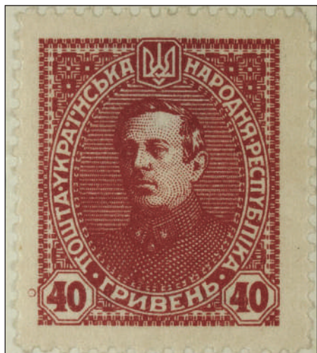
Рис. 2. Розмінна марка УНР гривневої вартості (1921 р.) на сайті проєкту Європіана 3

ні видання «France et Ukraine» (газета «Франція та Україна» видавалася в Парижі недовгий період на початку 1920 р. і фінансувалася Міністерством закордонних справ Української Народної Республіки [21]). Згадану вище спорадичність добре ілюструють результати пошуку на Європеані за прізвищами впливових діячів українських Визвольних змагань, а отже — еміграції міжвоєнного періоду. Так, згадки про Симона Петлюру на Європеані зустрічаємо в одиничних випадках, причому в першу чергу — у зв'язку з висвітленням його вбивства і наступного судового процесу над Самуїлом Шварцбардом, і лише одну — у зв'язку з іспанською колекцією грошових знаків і марок (Музей поштових колекцій Барселони), де представлені гривни і шаги періоду, як зазначається в описі, «Української Народної Республіки, незалежної держави, утвореної після падіння Російської імперії».