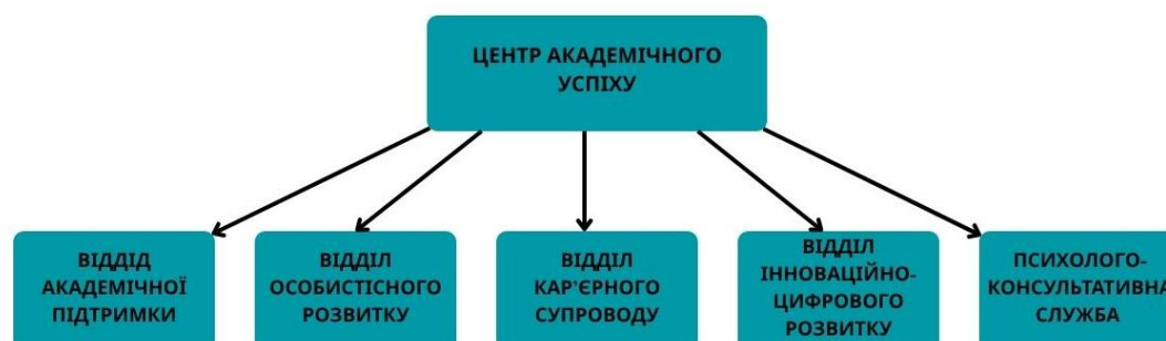
Схема центру академічного успіху