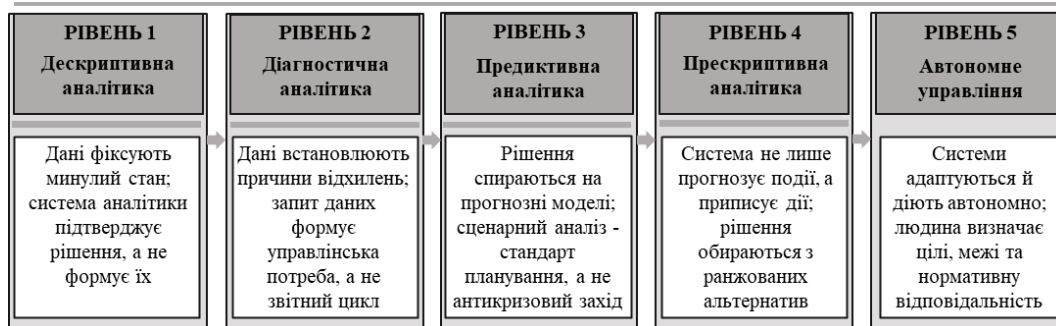
Рис. 1. Діагностична модель аналітичної зрілості управління на основі даних у міських агломераціях

Саме тому концептуалізація рівнів аналітичної зрілості управління агломерацією набуває не лише теоретичного, а й прикладного економічного значення. Кожен рівень характеризується зростанням технологічних можливостей опрацювання даних та управлінської ефективності — від фрагментарної візуалізації показників окремих територій до централізованих аналітичних систем, що інтегрують дані різних муніципалітетів агломерації та забезпечують прийняття обґрунтованих стратегічних рішень в режимі реального часу (рис. 1).