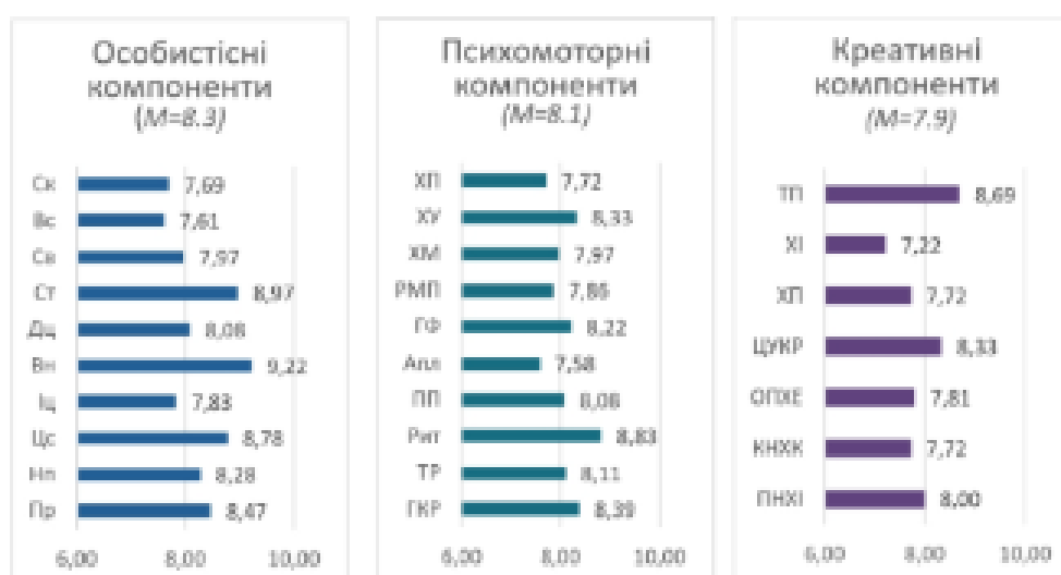
Рис.1. Середні значення оцінки студентами власних хореографічних здібностей

У дослідженні, яке проводилося у жовтні-листопаді 2025 року, взяли участь 36 студентів другого курсу бакалаврату Київського столичного університету імені Бориса Грінченка, що навчаються на факультеті музичного мистецтва і хореографії за освітньою програмою «Хореографія», спеціалізація «Хореографічне мистецтво». Студенти досить високо оцінили власні хореографічні здібності, що відображено на діаграмі (див. рис.1).