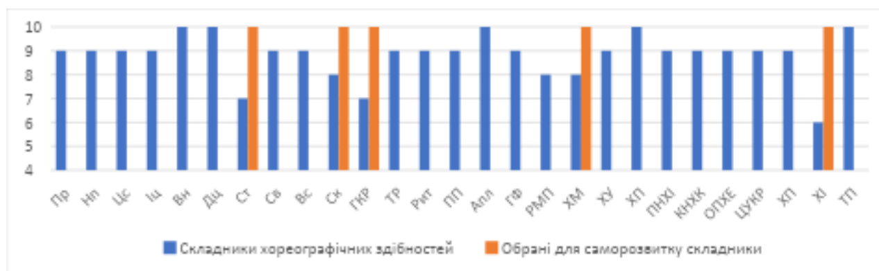
Рис.3. Рефлексійна самооцінка студентом В. власних хореографічних здібностей

У студентів, які тривалий час займаються танцями, вже сформувалася картина власних хореографічних здібностей, у якій не всі компоненти виражені однаково. Студент В. не планує розвивати одразу всі складники здібностей, а зосереджується на кількох: старанність, самоконтроль, гармонійна координація рухів, хореографічне мислення, хореографічна імпровізація. Зрозуміло, що це ті компоненти хореографічних здібностей, які, як він відчуває, по-перше, можуть