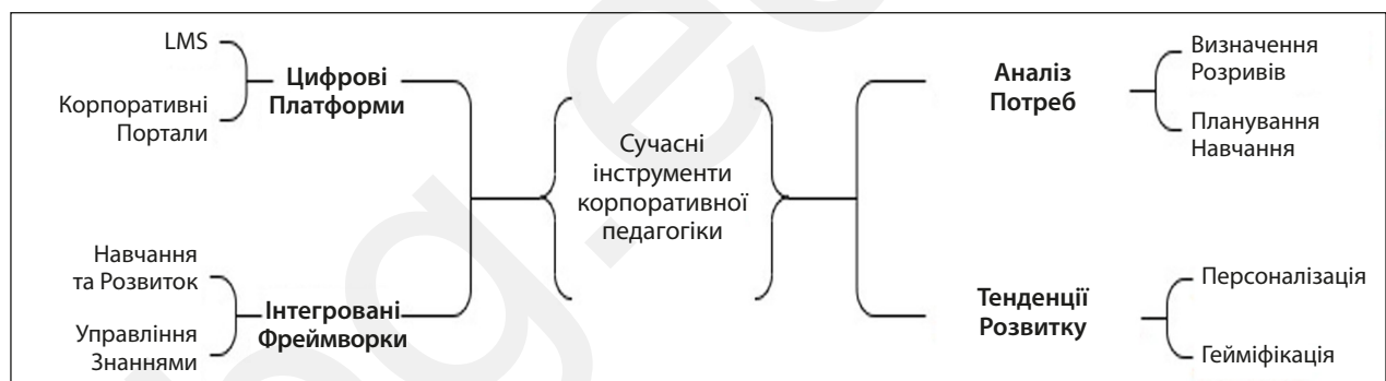
Рис. 1. Сучасні інструменти корпоративної педагогіки та розвитку персоналу

Узагальнено сучасні інструменти корпоративної педагогіки та розвитку персоналу представлено на рис. 1 .