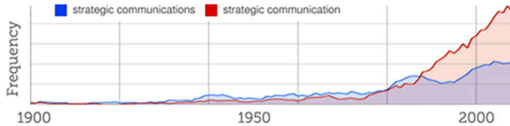
Рис. 1.1. Частота появи фрази «стратегічні комунікації» в книгах, відсканованих проєктом Google's books 26

Фраза «стратегічні комунікації» стала більш поширеною у 1990-х роках.