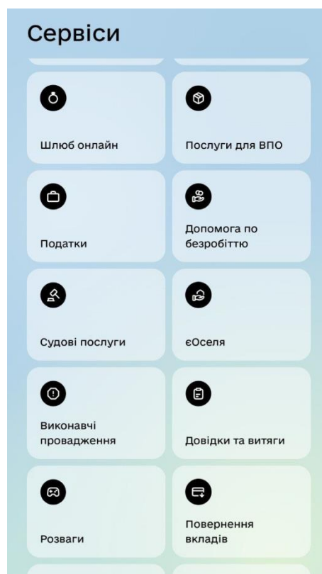
Рис. 2.1 Частина доступних послуг в мобільному застосунку “ДІЯ”

Одним із найбільш потрібних практичних втілень цієї концепції стала інтеграція бібліотечних послуг із державними екосистемами, насамперед платформою “Дія”. Оскільки Україна продовжує розвиток “держави в смартфоні”, розширюючи її послуги, а в селах немає ЦНАПів, тобто державної установи, в яку можна було б фізично прийти, бібліотека в селі бере на себе функцію вікна доступу до зазначеного е-уряду для тих категорій громадян, які не мають власних гаджетів або навичок роботи з ними.