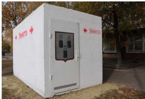
Рис. 3.1. Модульне укриття в Сумах[48]

невідповідність нормам ДБН В.2.2-5:2023.[46]. Натомість пропонується вирішити цю проблему комплексом інноваційних рішень, замість облаштування укриттів у часто непридатних до цього підвалах рекомендується закупівля та встановлення Первинних мобільних укриттів (ПМУ). Державні будівельні норми України (ДБН) так визначають первинні мобільні укриття - “ПМУ – це технічний виріб для захисту людей на місцевості у період воєнної небезпеки”[47]. такі укриття вже продемонстрували свою ефективність в Харкові, Сумах та інших містах України, які стикаються з постійною загрозою повітряних атак. В цих містах такі укриття найчастіше встановлюють на зупинках публічного транспорту, і хоча ПМУ не призначені повністю замінити звичайні захисні споруди, їх перевагою є швидкий період встановлення, відносно невелика ціна та можливість транспортування..