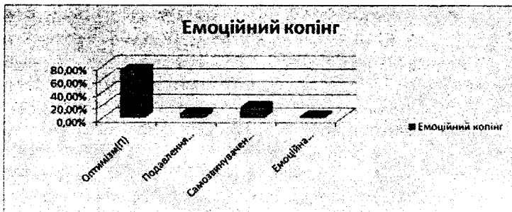
Рис. 3. Емоційні стрес-долаючі стратегії

Непродуктивні копінг-стратегії також мають місце в житті досліджуваних, оскільки бувають випадки недостатності знань, умінь, внутрішньої стабільності та зовнішньої підтримки. Залежно від індивідуальних особливостей непродуктивні стратегії проявляються в когнітивній сфері (розгубленість – 2,4%, покірність з тим, що трапилось – 2,4%), в емоційній сфері (пригнічення емоцій – 7,3%, втрата контролю над емоціями – 2,5%), в поведінковій сфері непродуктивні копінг-стратегії проявляються в активному уникненні вирішення проблеми (7,3%) та відступу від ідеї вирішувати життєві труднощі (4,9%).