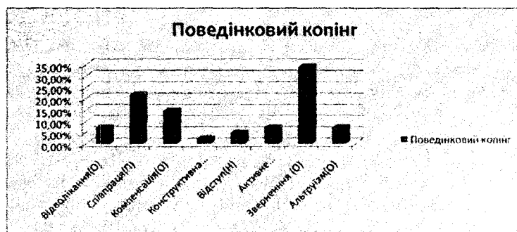
Рис. 2. Поведінкові стрес-долаючі стратегії

Продуктивні копінг-стратегії проявляються здебільшого в емоційній сфері респондентів. Найбільш характерна стратегія (30 респондентів – 73,2%) – це оптимізм (див. рис. 3). Саме така емоційна реакція на екстремальну, напружену, неприсмну ситуацію є ефективною, оскільки сприяє збереженню позитивного емоційного стану та втілює надію, віру і впевненість у вирішенні складної ситуації. 26,82% респондентів спрямовані до застосування проблемного аналізу, що є також продуктивною стратегією в когнітивному напрямку, а поведінкова продуктивна стратегія "співпраця" проявляється у 21,95% респондентів. Проблемний аналіз та співпраця сприяють швидкому, ефективному та корисному вирішенню проблем, збереженню внутрішньої рівноваги та створенню умов для подальшого функціонування власного організму в навколишньому світі.