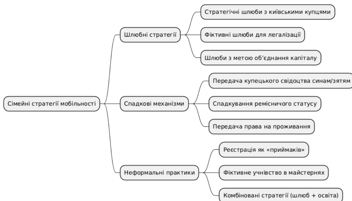
Рис. 3.1. Схема шлюбних і спадкових стратегій соціальної мобільності київської єврейської громади

Ця схема ілюструє основні шляхи, якими сім'ї використовували шлюб, спадковість і неформальні практики для соціального піднесення.