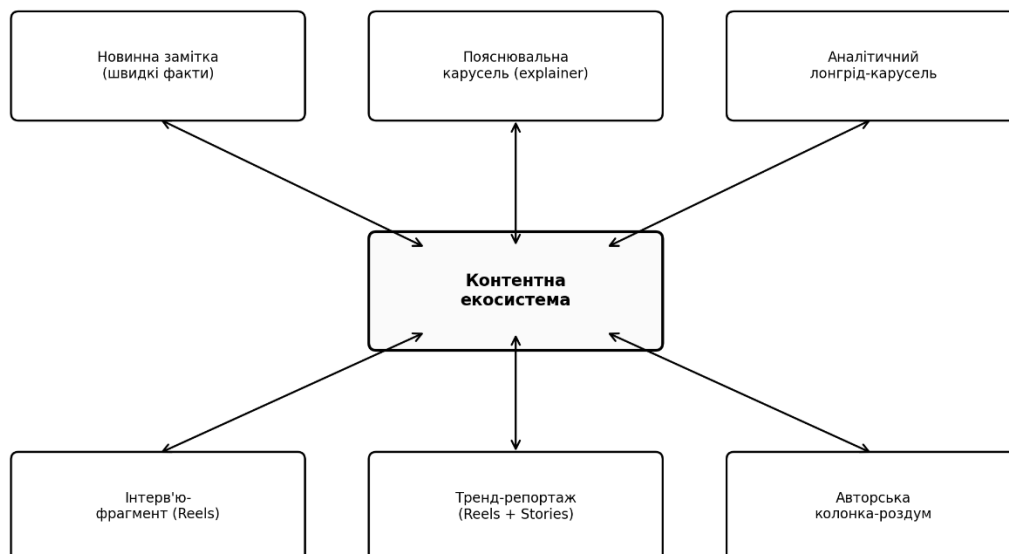
Рис. А.3 Технологічний процес створення та публікації контенту: від моніторингу тем до аналітики зворотного зв'язку.