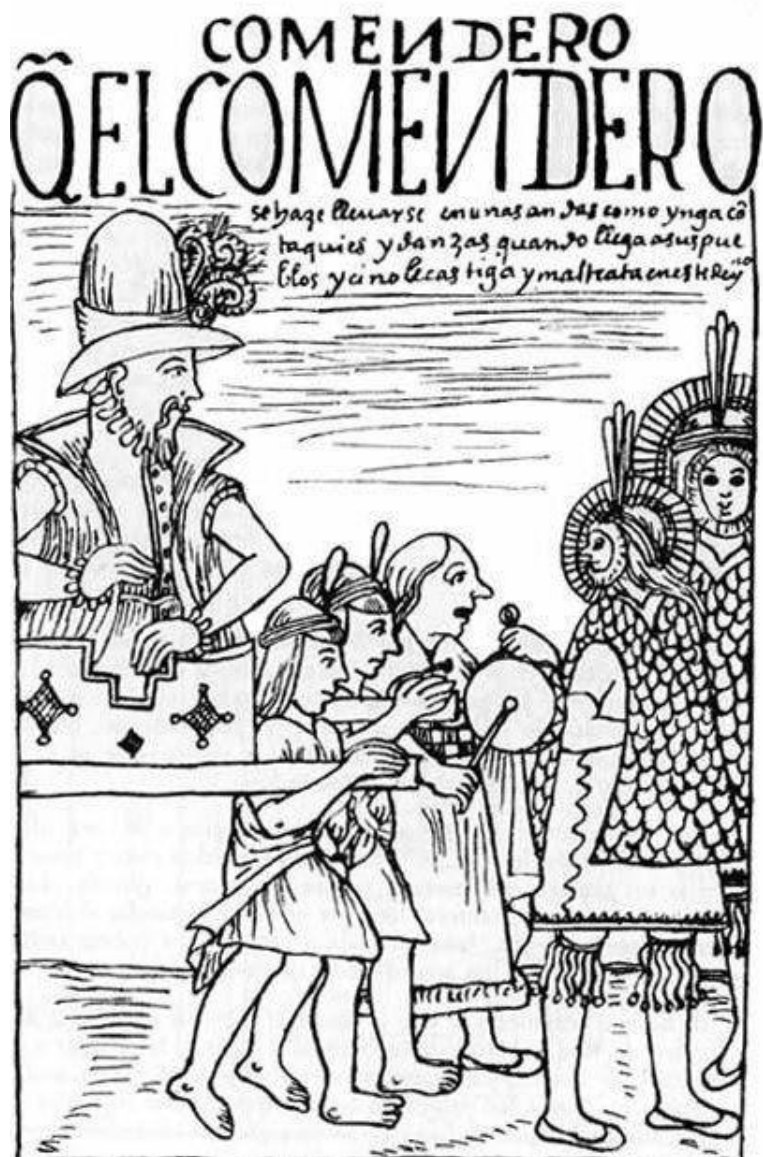
Рис. 1. "Encomendero en litera Inca" ("Енкомендеро в інських ношах").

Іспанського колоніста (енкомендеро), якого несуть на ношах корінні мешканці.