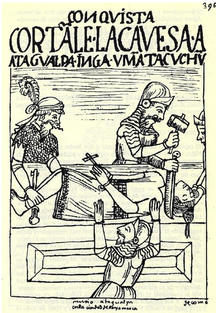
Рис. 2. «Страта короля інків Атауальпи»

автора це символ корупції та «світу комір-навиворіт» (mundo al revés), де загарбники живуть у розкоші, експлуатуючи місцеве населення.