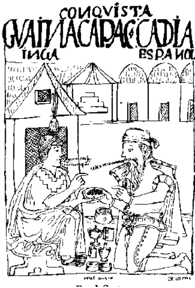
Рис. 4. Іспанський конкістадор та індіанець. Візуалізація концепції жадоби та екстрактивного характеру Конкісти.