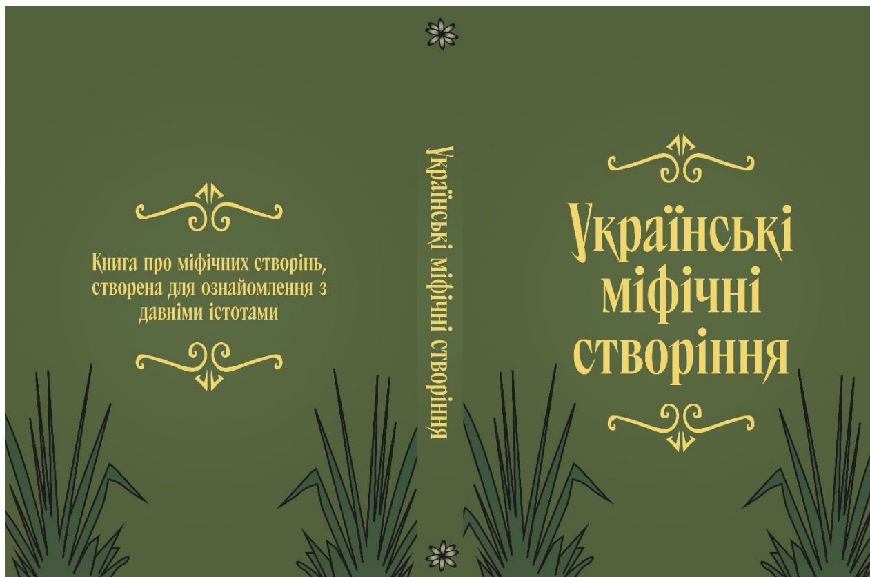
Додаток 3. Обкладинка