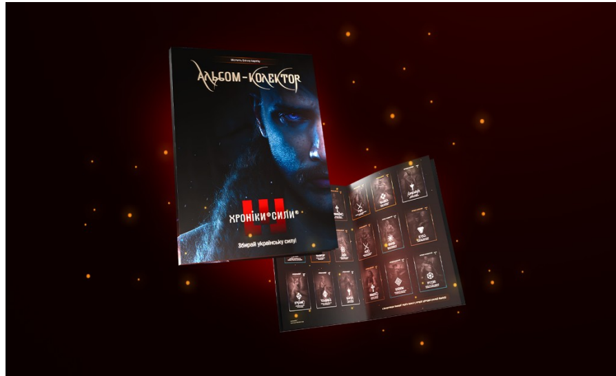
Додаток 1. Альбом АТБ з тематикою міфології, в якому є як місце для карток, так і розгортки про окремих персонажів