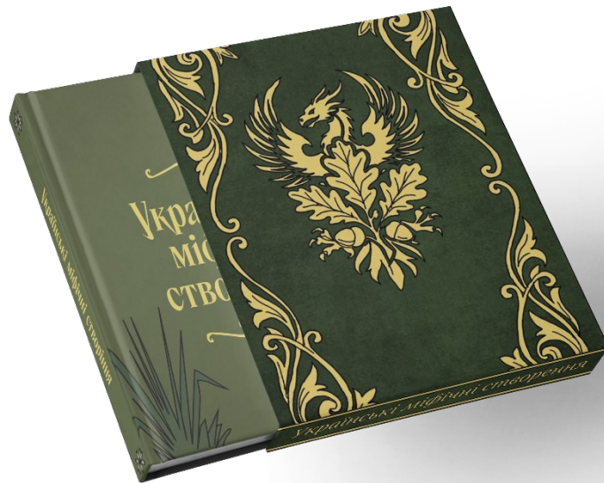
Додаток 10. Коробка для книги