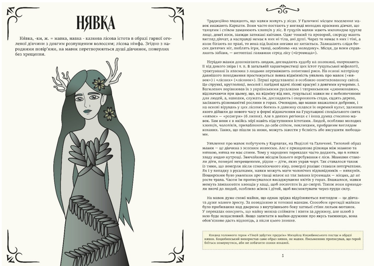
Додаток 4. Розгорт 1