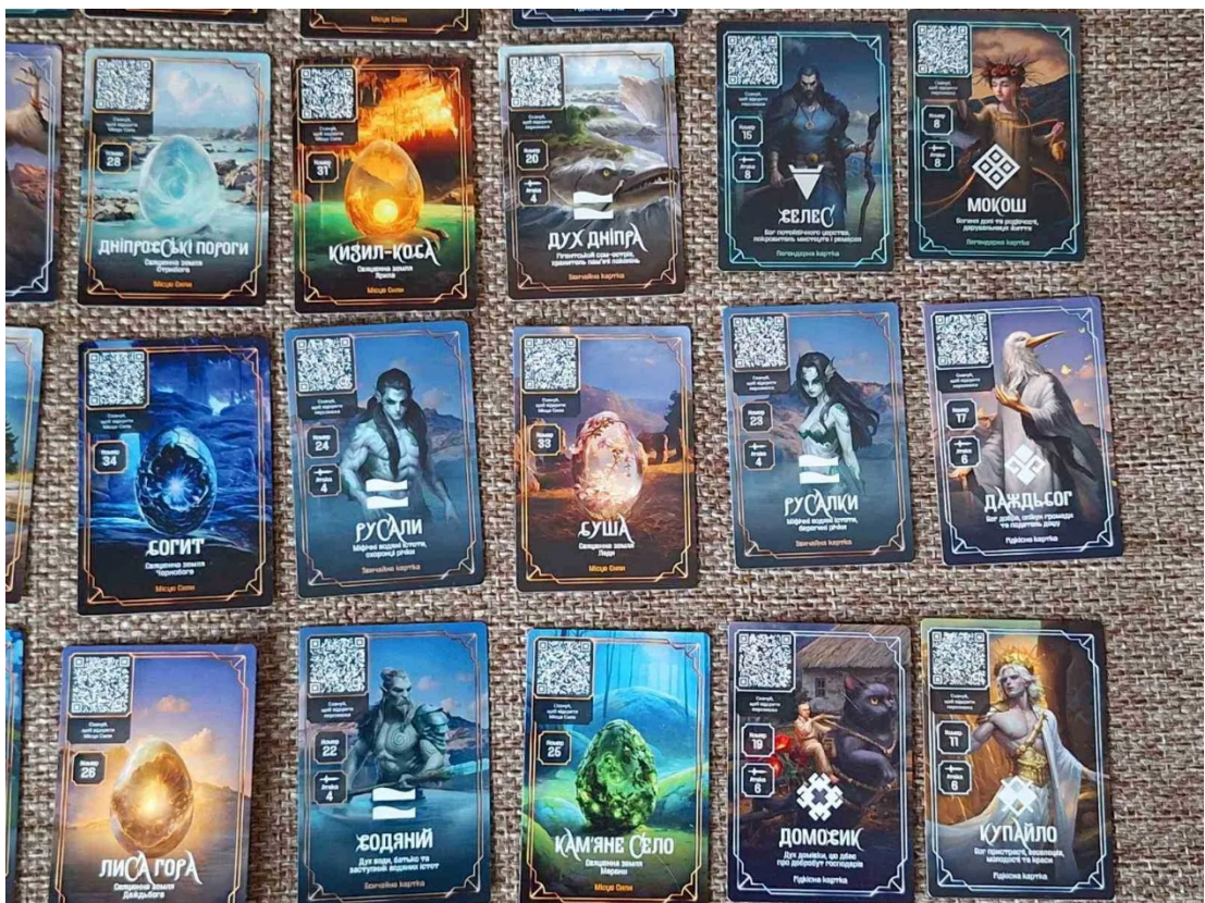
Додаток 2. Колекційні картки АТБ на тематику міфології