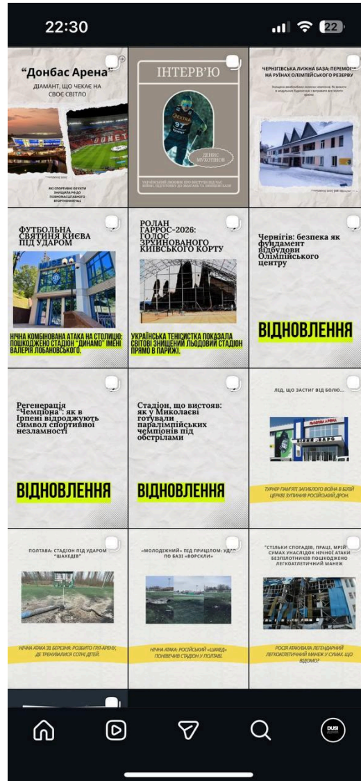
Рис. 2. Демонстрація наповнення сторінки: опубліковано три інтерв'ю, описуються об'єкти, які були пошкоджені до повномасштабного вторгнення, і після.