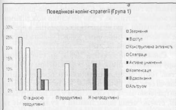
Рис. 6. Процентне співвідношення рівнів продуктивності поведінкової копінг-стратегії у студентів