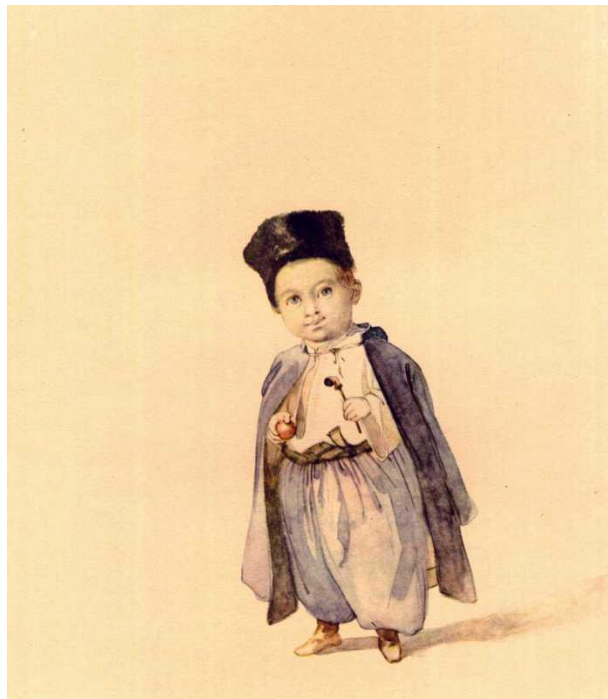
Рис. 1. Т.Г. Шевченко. Портрет Гаврила Родзянка. Папір, акварель (25,1 × 22,1 см). 1845.

Keywords: images of children, fine art, portrait, painting, watercolor, sepia.