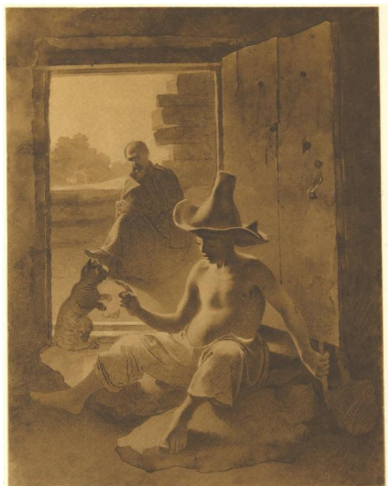
Рис. 2. Т.Г. Шевченко. Т. Г. Шевченко і казахський хлопчик, що грається з кішкою. Брістольський папір, сепія (25,3 × 19,7). 1856 -1857.