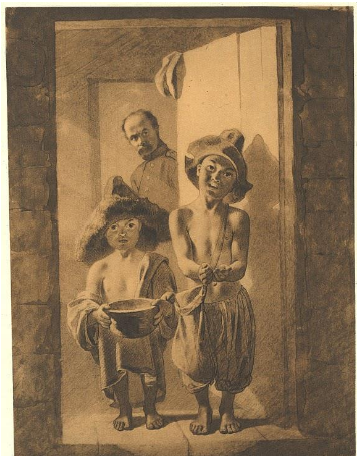
Рис. 3. Т.Г. Шевченко. Байгуші. Папір, сепія (28,8 × 22). 1853.